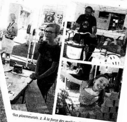
Plus ploemeurois. 2. À la force des mollets, fabriquer de l'électricité

▼ Pratique Contact au 06.63.33.89.47 ou 06.18.72.63.94 ou soye@soye.org