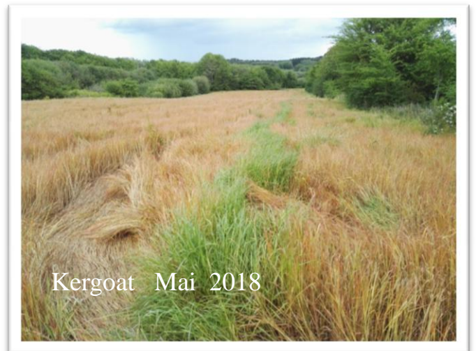
Kergoat Mai 2018