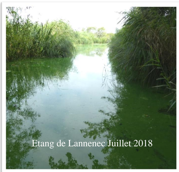
Etang de Lannenec Juillet 2018