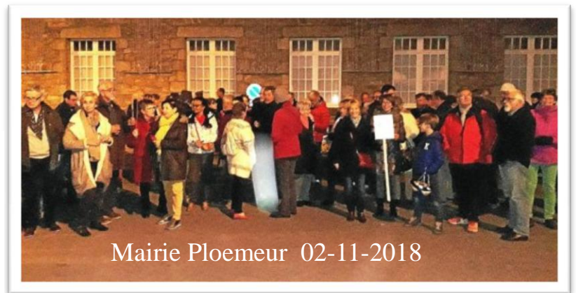
Mairie Ploemeur 02-11-2018