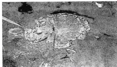
Ces cyanobactéries peuvent former des dépôts abondants, des mousses appelées efflorescences algales. Elles sont également connues sous le nom d'algues bleues.

Ces toxines peuvent former des risques sanitaires et aux pratiquants d'activités nautiques. Les effets peuvent être par des irritations et de la peau, du nez, de la gorge et des muqueuses en contact avec l'eau. Or, en cas de contact avec l'eau, des nausées ou vomissements peuvent survenir. Par mesure de précaution, le principe de précaution interdit sur le site la consommation des poissons. Le contact avec l'eau pour déterminer le site est interdit, et appelle à éviter les animaux domestiques.